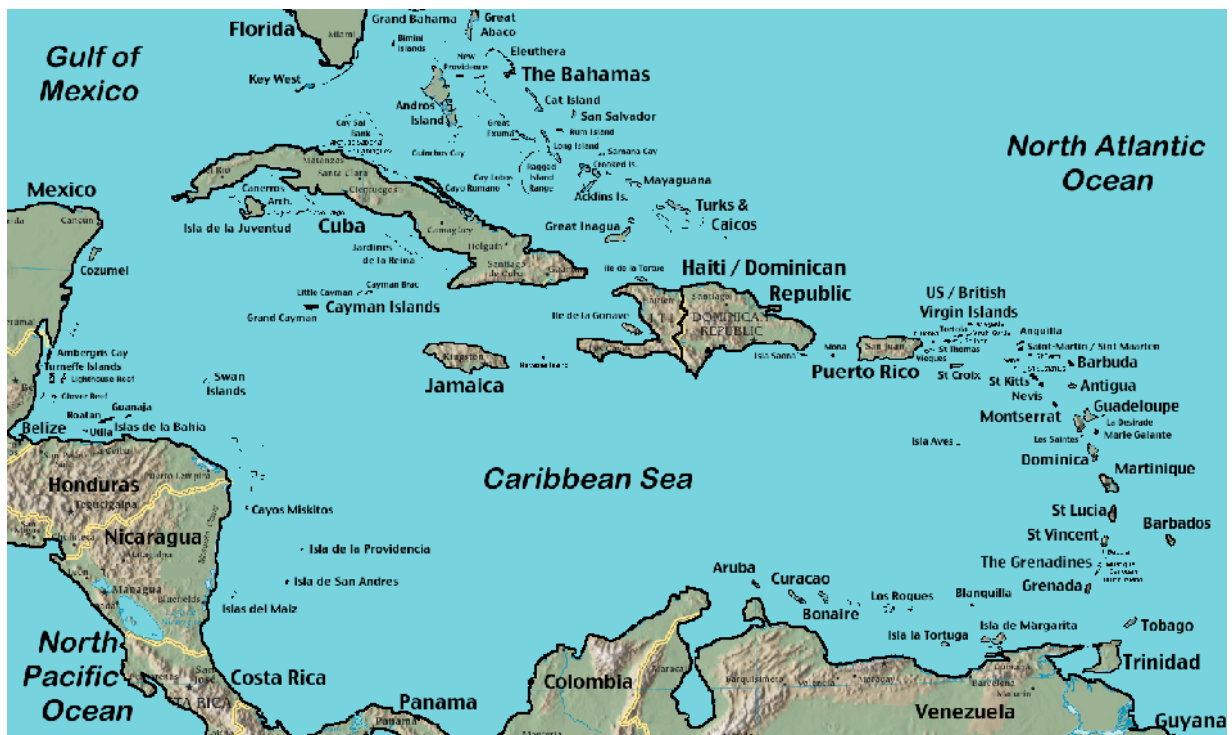
Mynd 1 Karíbahaf

Aðalframleiðsluvara eyjanna var löngum sykur og var sú atvinnugrein mikilvæg fyrir nýlendupjóðirnar. Enn þann dag í dag eru margar eyjanna undir yfirráðum vestrænna þjóða með einum eða öðrum hætti. Eftirfarandi listi sýnir helstu eyjar svæðisins og er tiltekið ef þær heyrta undir eða tilheyra vestrænum ríkjum eða ríkjasamböndum.